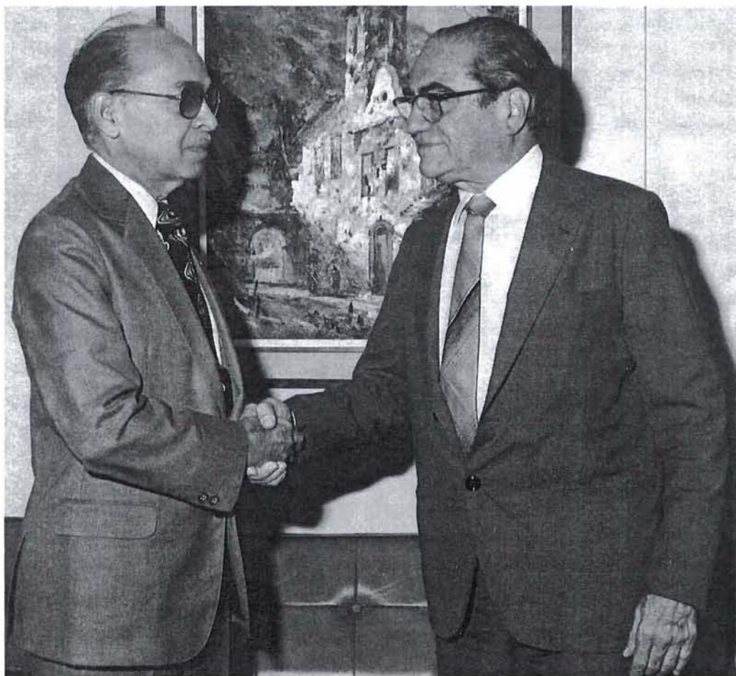
Em visita ao Ministro Aldir Passarinho, Presidente do STF, em 12/04/1991.