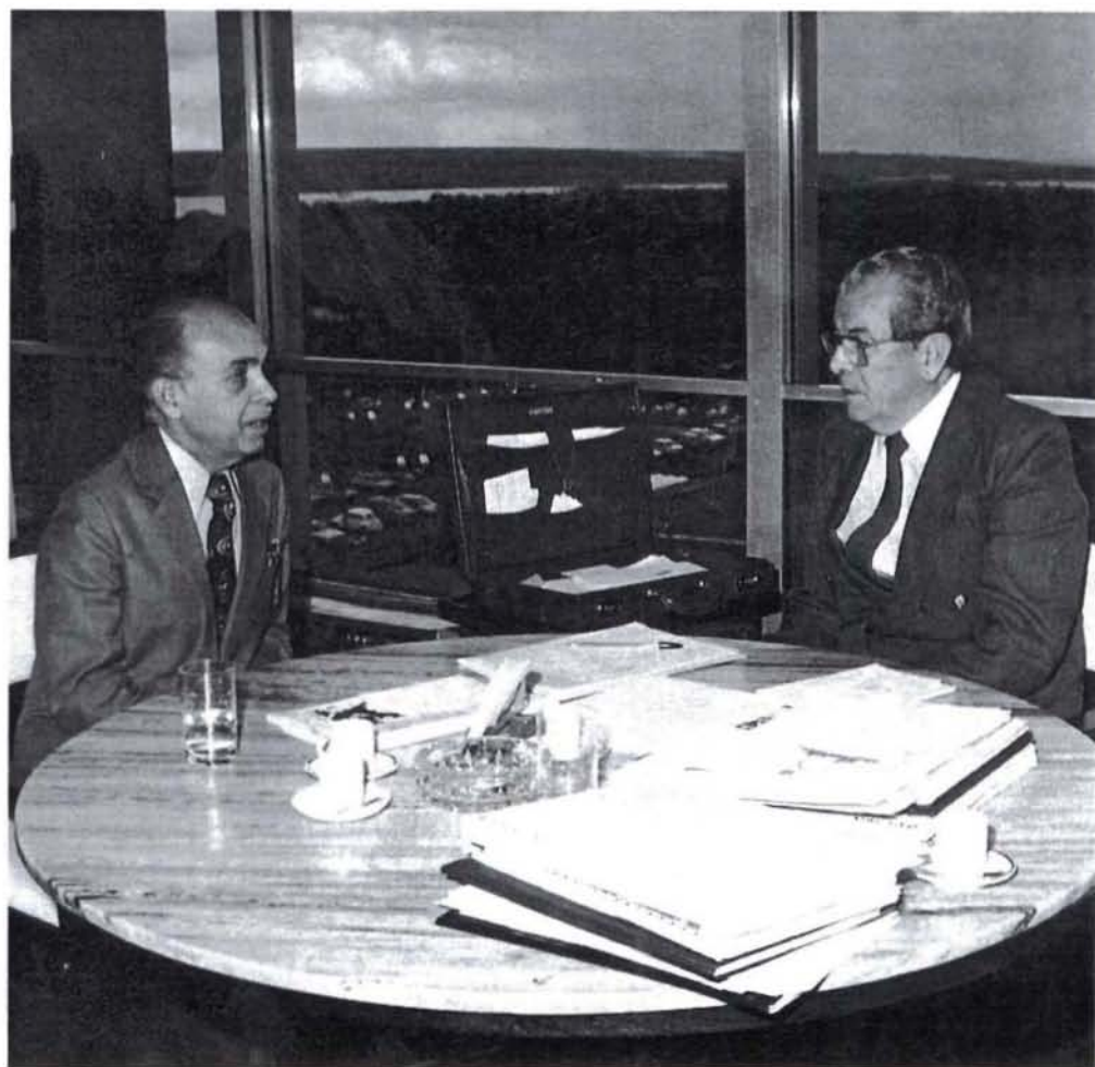
Em visita ao Ministro da Justiça, Senador Jarbas G. Passarinho, em 14/10/1991.