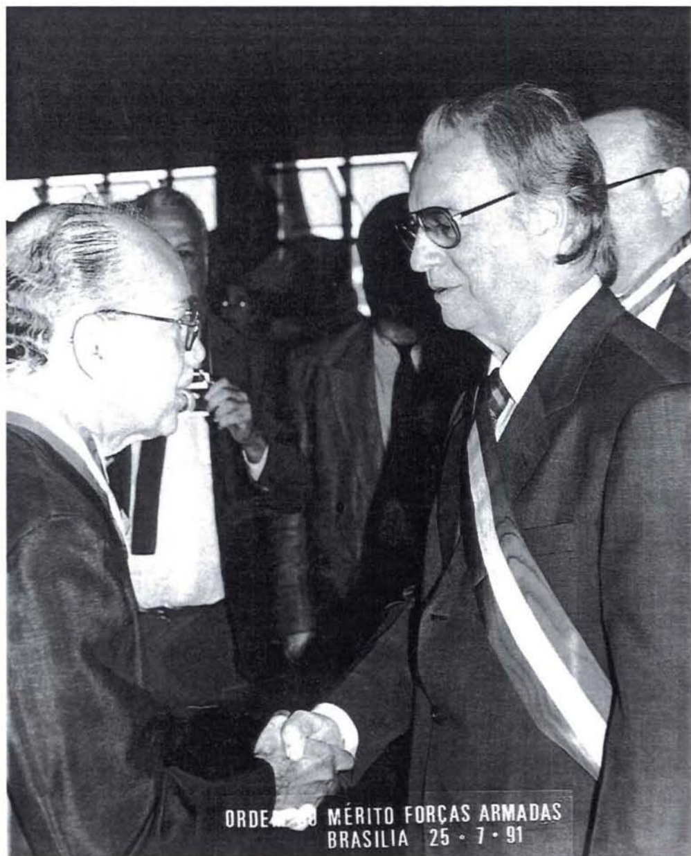
Recebe os cumprimentos do Dr. Itamar Franco, Presidente da República, ao ser condecorado com a Ordem do Mérito Forças Armadas, 25/07/1991.